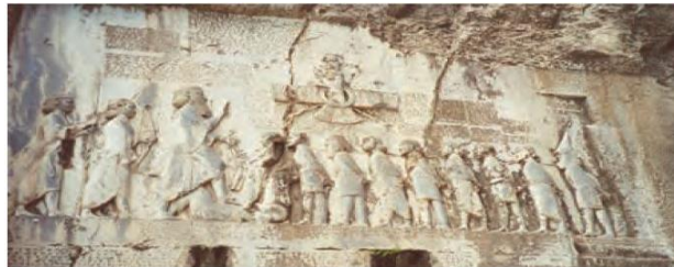
سنگ نگاره و کتیبه داریوش هفتمین در بیستون - داریوش در کتیبه بیستون از ۲۳ ایالت تحت فرمان خود نام برده است، مانند پارس، خوزیا (خوزستان)، بابل، مصر، ارمنیه (ارمنستان)، ارمنیا (ارمنستان) و ...