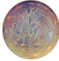
پنجاه زرین متعلق به دوره ساسانی