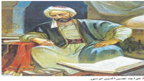
خواجسته نصیرالدین توسی

شخصیت‌ها و مفاخر، کتاب مطالعات اجتماعی پایه هشتم، صفحه ۹۱