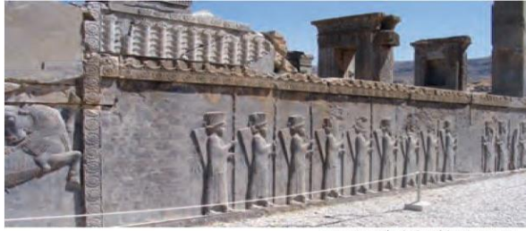
نقش برجسته سربازان سیاه چارپه‌ان در تخت جمشید

کتیبه و نقش برجسته، کتاب مطالعات اجتماعی پایه هفتم، صفحه ۱۲۶