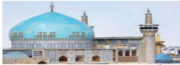
مسجد گوهرشاد، مشهد

مورد دوم مربوط به کاخ‌هاست. در گذشته مجموعه بناهایی منفرد با نوعی معماری برتر از دیگر بناها احداث می‌شد که کاخ یا قصر نامیده می‌شد (کیانی، ۱۳۹۳: ۱۲). کاخ‌ها مرکز حکومت و محل اداره‌ی مملکت به حساب می‌آمده است. در این کتاب‌ها در بین کاخ‌ها توجه بیشتر معطوف به تخت جمشید است. مورد سوم کتیبه‌ها و نقش برجسته‌ها است. کتیبه‌ها و نقش برجسته‌های مختلف و متنوعی که بر صخره‌ها و کوه‌ها کنده شده از دو بعد قابل اهمیت است، یکی بعد هنری که نشان از شاهکار حجاری آن دوره است و دیگری بعد سیاسی آن که حاکی از تحولات تاریخی دوره‌های مختلف است. با درک و اهمیت جایگاه کتیبه‌ها و نقش برجسته‌های دوره‌های مختلف تاریخی می‌توان تحولات اندیشه و مسائل فکری، فعالیت سازمان‌های دینی و حس زیبایی شناسانه جامعه را در ادوار مختلف تاریخی شناخت (علم‌الهدایی، ۱۳۹۴: ۱۰۴).