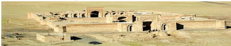
کاروانسرای تبریز در نزدیکی سرخس (استان خراسان رضوی)

کاروانسرا، کتاب مطالعات اجتماعی پایه هشتم، صفحه ۸۸