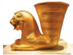
ریتون * (تکوک) شیر غزان هخامنشی

در مقابل به تعدادی از مؤلفه‌ها از جمله زیورآلات و لوح‌ها به نسبت دیگر مؤلفه‌ها کمتر توجه شده است. احمدی (۱۳۸۷) درباره‌ی زیورآلات و اشیا تزئینی می‌گوید که ساخت زیورآلات و اشیا تزئینی از هزاران سال پیش در ایران متداول بوده و به‌عنوان هنری گرانبها و ارزشمند برای اقشار مختلف جامعه تلقی می‌شده است. این ساخته‌ها در دوران مختلف از تکنیک فوق‌العاده، نقوش بیاد ماندنی و فرم‌های حیرت‌انگیزی برخوردار بوده‌اند که خلاقیت و توانمندی حیرت‌برانگیز سازندگان این اشیا را نشان می‌دهد، که با توجه به قدمت و فنون به کار رفته در ساخت آنها در کتاب‌های مطالعات اجتماعی دوره اول متوسطه کمتر به آن پرداخته شده است. مورد بعدی لوح‌ها هستند. لوح‌ها آثار ارزشمندی‌اند که از گل، قیر و دیگر مواد ساخته شده‌اند و در سطحی کوچک‌تر، کارکردی شبیه به کتیبه‌ها و نقش برجسته‌ها دارند و اطلاعات زیادی از زمان گذشته را در اختیار ما می‌گذارند.